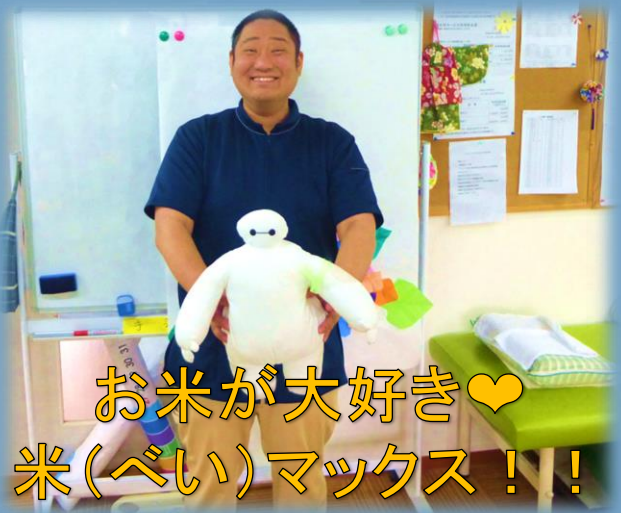
お米が大好き♡ 米(べい)マックス！！