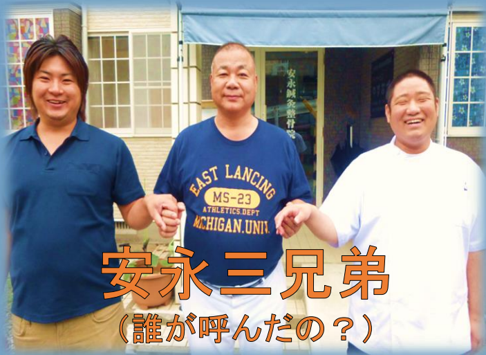
安永三兄弟 (誰が呼んだの?)